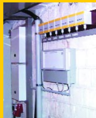
Datenkonzentrator mit Transpondern