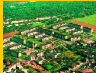
EuroTRACE Pilotprojekt Essen: Verteilung und Abrechnung von 28 Häusern mit 583 Wohneinheiten

Es können von einem Gerät bis zu 1.000 Transponder verarbeitet werden, die zu einem definierten Zeitpunkt über ein Modem zu einem WAN oder