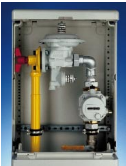
Abb. 1: MR 25 F-G mit RVG G25 im Schrank installiert

Eine andere Variation von RVG und Regelgerät ist die umgekehrte Anordnung mit dem Drehkolbengaszähler im Vordruck des Regelgerätes. Der RVG ist für Drücke bis 20 bar zugelassen und kann damit im Gegensatz zu einem Balgengaszähler dort installiert werden. Bei einem Vordruck von z. B. 3 bar im Mitteldrucknetz ist ein G25 mit Q_{\max} = 4 \times 40 \text{ Nm}^3/\text{h} äquivalent zu einem Balgengaszähler G100 bei erheblich kleinerem Gewicht und Platzbedarf (Abb. 2). Zugebenermaßen ist dieses Beispiel extrem, aber auch im 1 bar-Mitteldrucknetz erreicht man eine Äquivalenz zu einem Zähler mindestens der Größe G40 auf der Ausgangsseite des Gasdruckregelgerätes.