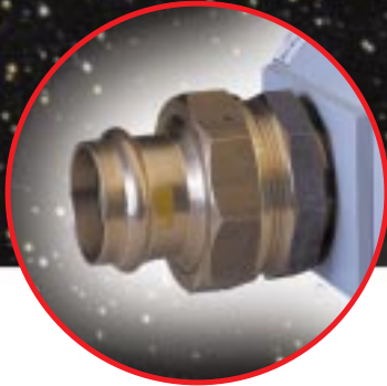
Abb. 5: Anschlussstück für Verbindung ohne Verwendung der ELSTER-Messingdrehteile.

Die Abb. 5 zeigt den Anschluss ohne Verwendung der ELSTER-Messingdrehteile. Die Verschraubung Nr. 379 445 wird in das Zählergehäuse eingeschraubt. Da dieses Verschraubungsstück konisch abdichtet, empfiehlt es sich, die Verschraubung mit einem geeigneten Kleber zusätzlich zu fixieren und abzudichten. Die Rohrleitung DN 40, 1 1/2" kann direkt angeschlossen werden. Für die kleineren Leitungsquerschnitte stehen die oben angeführten Reduzierstücke zur Verfügung.