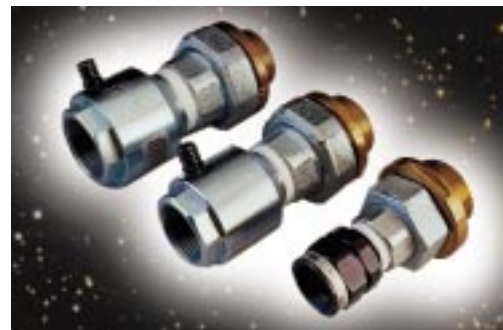
Abb. 3: TAE für DN 40-, DN 32- und DN 25-Rohrleitungen

Da aber die Gerätekombination im Vordruckbereich installiert wird, kompensiert das Regelgerät den zusätzlichen Druckabfall ohne Nachteile auf der Brennerseite. Ist zur Verrechnung statt des Betriebsvolumens das Normvolumen gefragt, dann ist das kein Problem, denn der „Zweierpack“ lässt sich zum höchst kompakten „Dreierpack“ mit EK210 erweitern (Abb. 4).