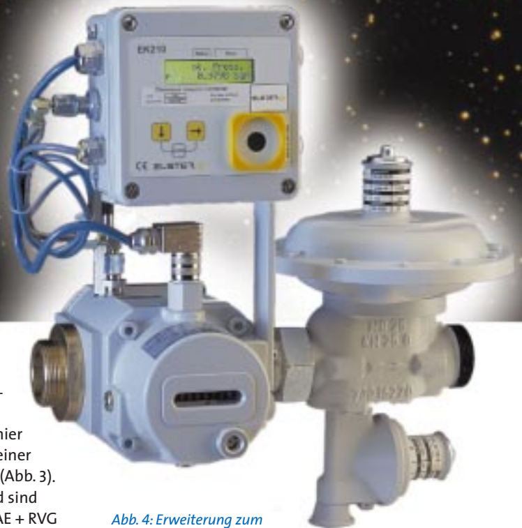
Abb. 4: Erweiterung zum „Dreierpack“.

Nun könnte man in diesem Fall die fehlende HTB-Beständigkeit des RVG als Gegenargument anführen. Aber auch hier bietet sich eine kompakte Lösung mit einer separaten TAE am Eingang des RVG an (Abb. 3). Wir haben die Anordnung getestet und sind sehr zufrieden. Der Druckverlust von TAE + RVG beträgt für die DN 40-Leitung bei 40 m 3 /h \Delta p = 3,6 mbar gegenüber 2,4 mbar ohne TAE.