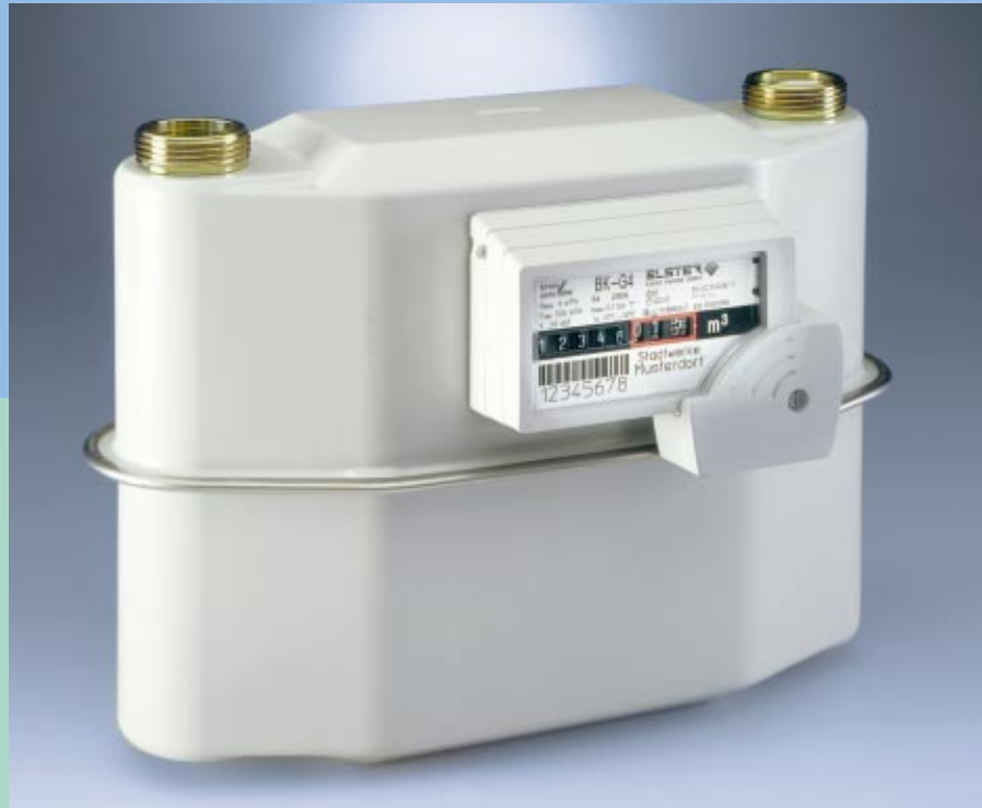
BK-G4 mit Absolut-ENCODER

Der M-BUS ist ein kostenoptimierter, in Hardware und Protokoll genormter Zweidraht-Feldbus (EN 1434). Auf ihn kann jedes in der Hausversorgung gebräuchliche Messgerät mit M-BUS-Schnittstelle aufgeschaltet werden. Voraussetzung ist natürlich, dass es mit einer entsprechenden Schnittstelle ausgerüstet ist. So können alle Geräte vom Heizkostenverteiler über den Wasserzähler, Wärmezähler, Stromzähler und den Gaszähler über ein Bus-System ausgelesen werden.