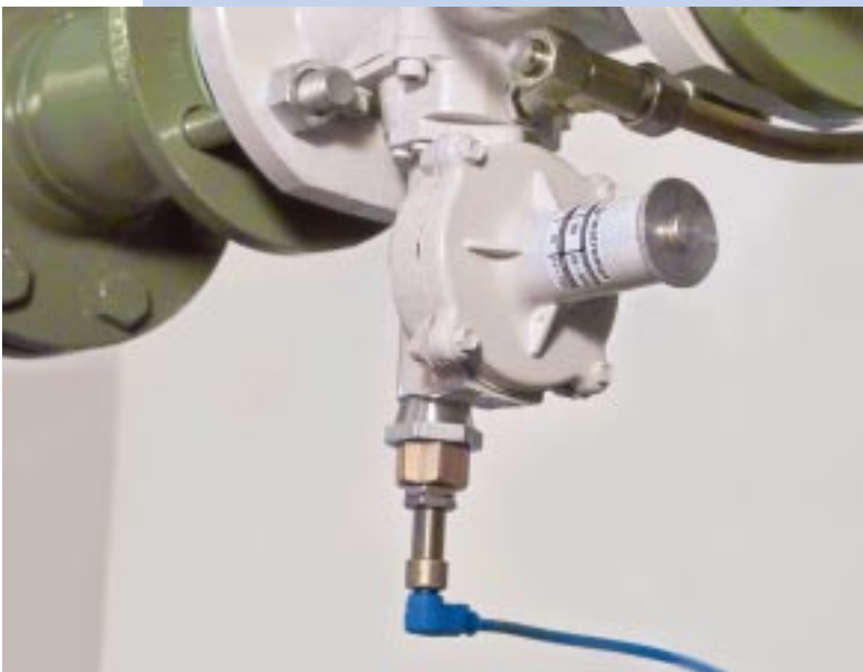
Gasdruckregelgerät mit SAV-Fernabfrage

Dies ist zum Beispiel über den Anschluss an einen Statuseingang eines Datenspeichers vom Typ DL220 oder DL240 möglich. Diese Geräte können so den Zustand des SAVs überwachen und im Störfall über ein angeschlossenes Modem auch das Servicepersonal via SMS alarmieren.