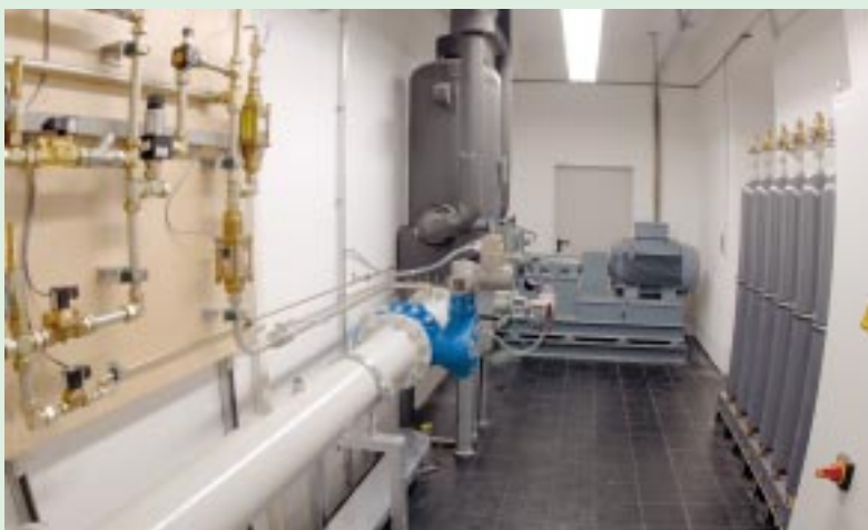
Abb. 3: Technikraum mit Hochdruckgebläse

Die Kunden von Elster-Instromet haben künftig die Möglichkeit, einen Gaszähler einschließlich der Hochdruckprüfung und dem Zertifikat aus einer Hand zu beziehen.