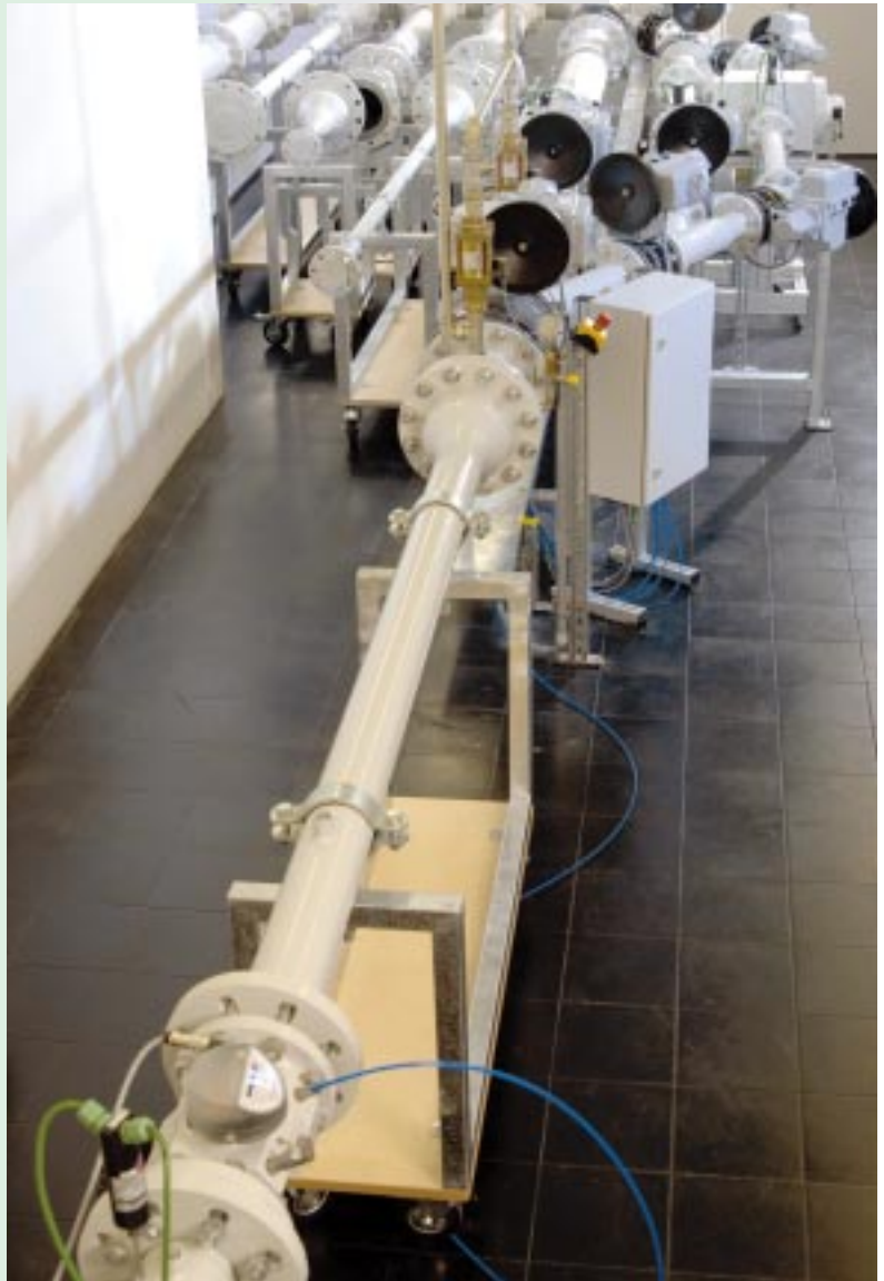
Abb. 2: Unter Druck – TRZ-Prüfling

Somit haben wir zukünftig die Möglichkeit, schnell und flexibel auf Kundenwünsche bezüglich des Liefertermins zu reagieren. Ein weiterer Vorteil ist der geschlossene Kreislauf: Zum einen ist jeder Druck innerhalb des Druckbereichs einstellbar, zum anderen ist die Anlage unabhängig von jahreszeitlichen Schwankungen.