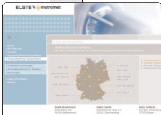
Abb. 1: Auf der Startseite das Produktspektrum, Text und Bild – für jeden Leser das Passende