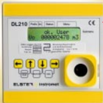
DL210 mit integriertem GSM/GPRS-Modem