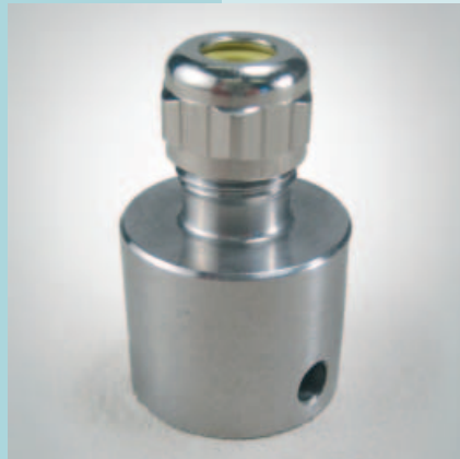
Abb. 3: Adapter für alte Fühlertaschen EBL50/67