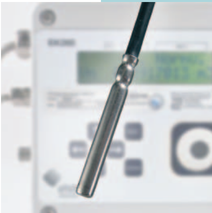
Abb. 1: Universal-Temperaturfühler