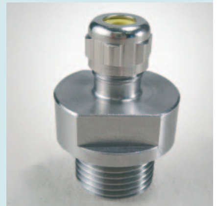
Abb. 4: Adapter für Fühlertaschen EBL160/250