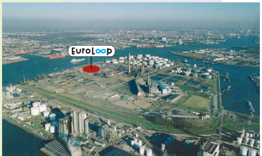
EuroLoop-Areal für die Kalibrieranlage im Rotterdamer Hafen

EuroLoop soll der weltweit größte Prüfstandort für Durchfluss- und Mengemessung bei Erdgas und Erdöl werden. Das Projekt wird auf einem 200 x 100 Meter großen Areal in Rotterdam Pernis am Ufer der Nieuwe Maas gebaut. Zusätzlich zu den