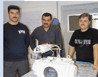
Product training for two Azerigaz Engineers (left) at Elster in Germany